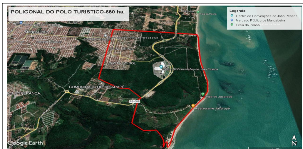
Figura 01. Area do Polo Turístico Cabo Branco com 650 hectares.

A área onde será realizado os Estudos é identificada na figura abaixo com 650 ha.