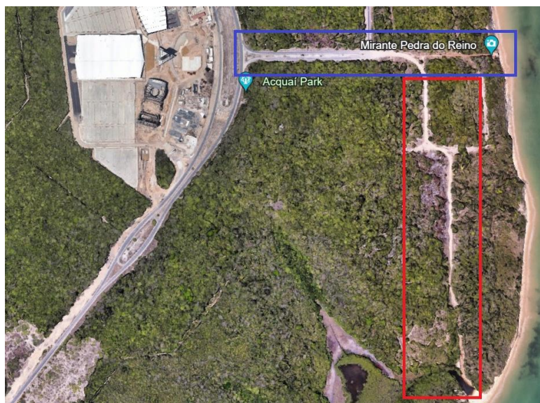
Figura 1 – Localização do Distrito Industrial de Turismo com indicação do “Boulevard dos Ipês”

A obra denominada “Boulevard dos Ipês”, local onde deverão ser realizados os serviços referentes ao Objeto deste Termo de Referência, fica localizada em uma área do Distrito Industrial de Turismo (Polo Turístico Cabo Branco) na região de João Pessoa/PB, às margens da Rodovia PB 008 Avenida Panorâmica, conforme observado na Figura 1 a seguir.