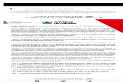
IMG-20250326-WA0029.jpg 178 KB